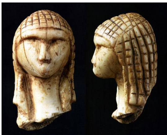
La Dame de Brassempouy.

Le Paléolithique supérieur en France débute avec le Châtelperronien, du nom du site français de Châtelperron. Présente surtout dans le sud-ouest de la France, cette industrie est généralement attribuée aux derniers Néandertaliens même si l'association Châtelperronien / homme de Néandertal est contestée par certains auteurs. Le Châtelperronien est caractérisé par les premiers éléments de parure européens ainsi que par le développement de l'industrie sur matière dure animale (os, bois), selon certains sous l'influence des Homo sapiens venus du Proche-Orient et porteurs de l'Aurignacien. Celui-ci s'étend sur le territoire à partir de l'Europe centrale. Son site éponyme est la grotte d'Aurignac. Les Néandertaliens disparaissent du territoire actuel de la France aux alentours de 35 000 ans BP. En France, l'Aurignacien est caractérisé par l'une des plus anciennes grottes ornées au monde, la grotte Chauvet. Datée d'environ 31 000 ans BP, son dispositif pariétal témoigne d'une importante maîtrise technique et artistique, brisant les idées jusqu'alors établies d'une évolution linéaire de l'art paléolithique depuis des expressions abstraites jusqu'au réalisme.