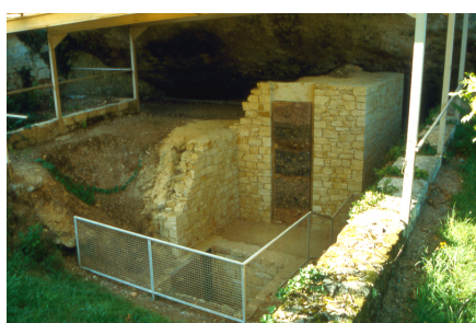
Abri inférieur du Moustier

Les premiers travaux concernant l'abri inférieur sont ceux d'O. Hauser en 1907. Ils permettent la mise au jour d'un squelette de Néandertalien dans des conditions déplorable : les restes humains, désignés par Le Moustier 1 , sont plusieurs fois exhumés puis ensevelis devant différents scientifiques croyant à chaque fois être les premiers témoins de la découverte. Le squelette est ensuite vendu au Musée de Berlin. Seul le crâne existe encore, le reste du squelette ayant été détruit à la fin de la Seconde Guerre mondiale.