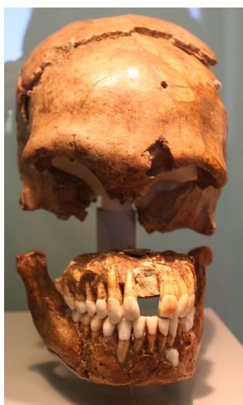
Le Moustier 1 . Crâne vu de face, conservé au Musée de Préhistoire et de Protohistoire de Berlin

Les premiers travaux concernant l'abri inférieur sont ceux d'O. Hauser en 1907. Ils permettent la mise au jour d'un squelette de Néandertalien dans des conditions déplorable : les restes humains, désignés par Le Moustier 1 , sont plusieurs fois exhumés puis ensevelis devant différents scientifiques croyant à chaque fois être les premiers témoins de la découverte. Le squelette est ensuite vendu au Musée de Berlin. Seul le crâne existe encore, le reste du squelette ayant été détruit à la fin de la Seconde Guerre mondiale.