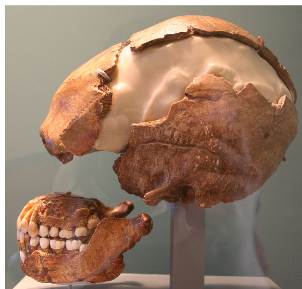
Le Moustier 1 . Crâne vu de profil

D. Peyrony y entreprend également des travaux à partir de 1910. En mai 1914, il y découvre le squelette d'un jeune enfant néandertalien — Le Moustier 2 , entreposé au Musée des Eyzies et oublié jusqu'à sa redécouverte en 1996 et son étude par B. Maureille en 2002 [3] . Une reconstruction virtuelle du crâne du nouveau-né a été effectuée, permettant de comparer les formes et volumes endocrâniens à la naissance des Néandertaliens et des Hommes anatomiquement modernes [4] .