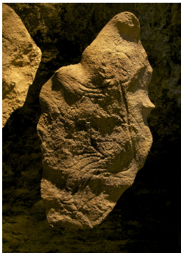
fac-simile de la gravure du "Sorcier", visible dans le petit musée à l'entrée de la grotte.

La grotte de Saint-Cirq , également appelée grotte du Sorcier , est un des sites classés au patrimoine mondial par l'Unesco parmi les sites préhistoriques et grottes ornées de la vallée de la Vézère. Elle se trouve sur la commune de Saint-Cirq en Dordogne. Elle fut découverte tardivement en 1951.