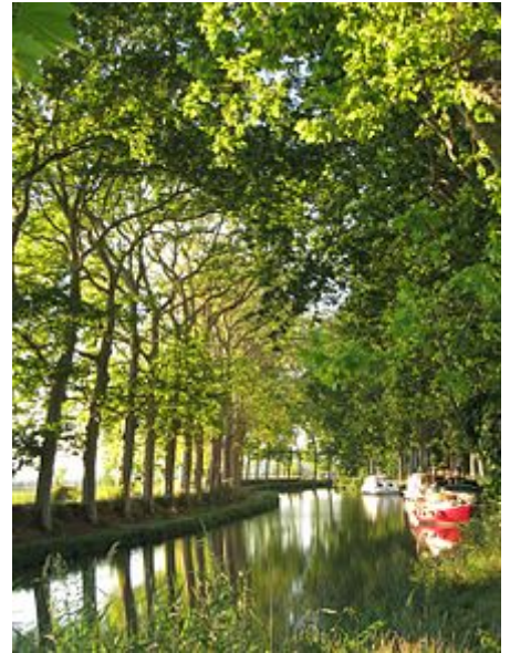
Canal du Midi

La lettre R signifie que ce canal est radié de la nomenclature des voies navigables, la lettre A qu'il est aliéné (transformé en autre chose : parking ou voie rapide le plus souvent).