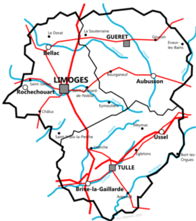
carte du Limousin

Le Nord, l'Ouest et l'Est de la région sont parcourus par des rivières appartenant au bassin de la Loire (Vienne, Creuse, Gartempe, Taurion, Briance...), le Sud par des cours d'eau appartenant à celui de la Dordogne (Vézère, Corrèze, Isle...). La région est traversée par deux fleuves : la Dordogne et la Charente (qui prend sa source dans la Haute-Vienne ).