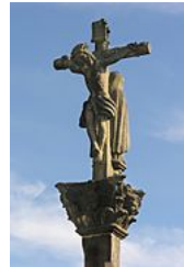
Ponte Maceira, Negreira