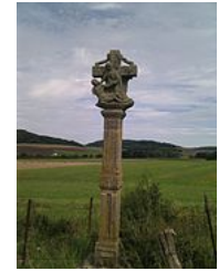
Crox de chemin à Rugney (Vosges).