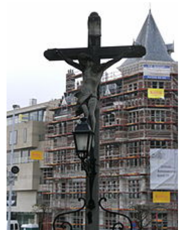
Un crucifix dans les rues d'Anvers.