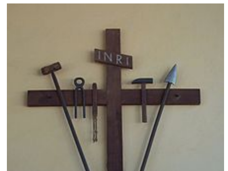
Croix avec Arma Christi, Poppiano, près de Montespertoli, Toscane.