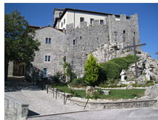
Calvaire de l'abbaye de Castelmonte .