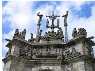
Pleyben, face ouest.