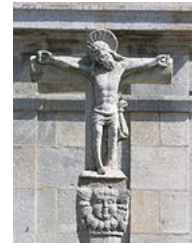
Vilanova de Arousa