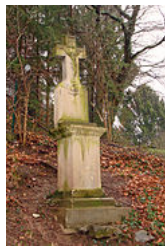
Croix de chemin, Forbach (Moselle).