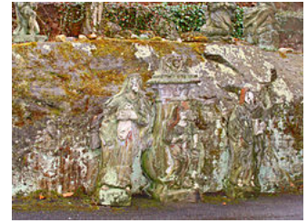
Calvaire sculpté dans le rocher, Forbach (Moselle).