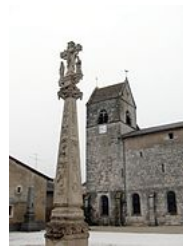
Calvaire de Troussey (Meuse).