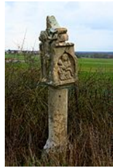
Bildstock de d'Œutrange (Moselle).