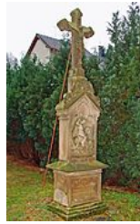
Croix de chemin de Rech (Moselle).