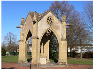
Calvaire d' Ennery (Moselle).