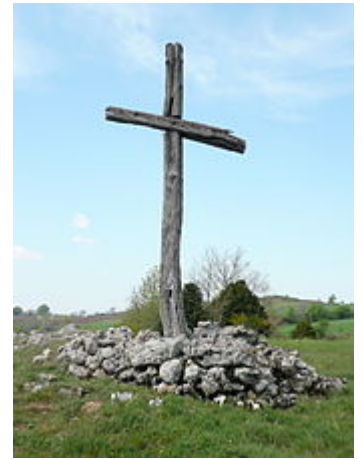
Croix de bois, sur le plateau du Larzac.