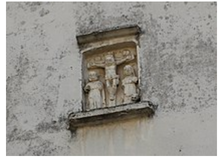
Calvaire mural sculpté à Marault Bologne, Haute-Marne.