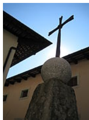
Croix de l'abbaye de Castelmonte .