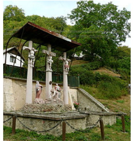
Calvaire en Slovaquie centrale.

Le mot "calvaire" provient du latin calvaria , lui-même provenant de l' araméen golgotha 2 .