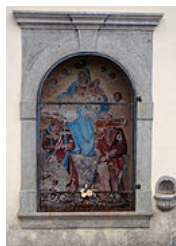
Ancona du Pont des Anges de Torlano (commune de Nimis ).