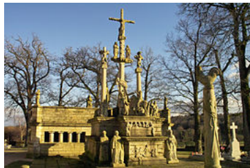
Le calvaire du cimetière de Guéhenno.