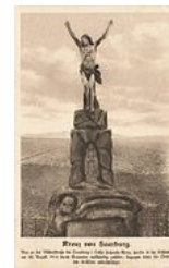
Christ sans croix à Buhl , près de Sarrebourg .