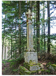
Croix de La Petite-Fosse (Vosges).