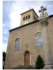
Bildstock de Novéant-sur-Moselle .