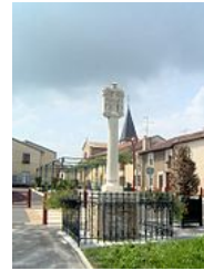
Bildstock de Vandières (Meurthe-et-Moselle).