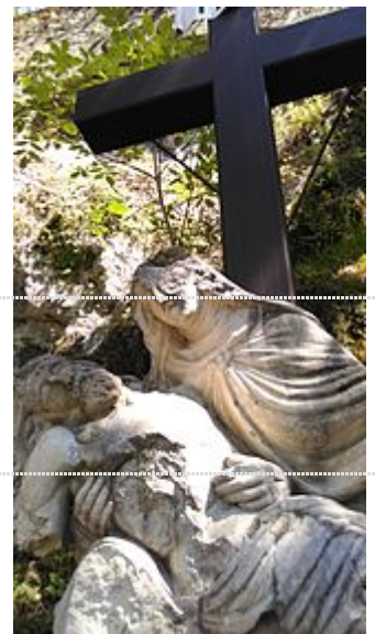
Les Pénitents Noirs, faubourg Reclus à Chambéry.