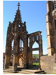
La Recevresse (ciborium) d' Avioth (Meuse).