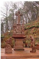
Calvaire de la Chapelle Sainte-Croix de Forbach .