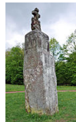
Menhir christianisé de Meisenthal (Moselle).