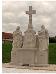
Calvaire de L'Hôpital (Moselle).