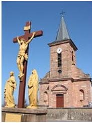
Calvaire de Saint-Michel-sur-Meurthe (Vosges).