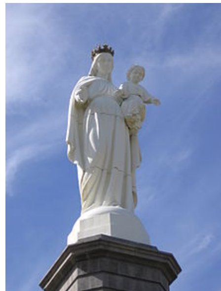
Notre-Dame de Haute-Auvergneà Murat.