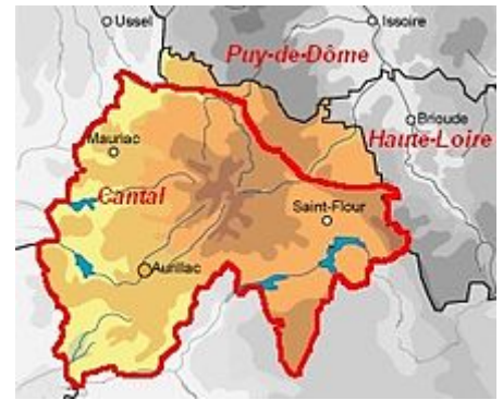
Limites du bailliage des Montagnes d'Auvergne superposées à la carte du département du Cantal.

Selon Ferdinand Lot , en 1328, le bailliage d'Auvergne comprenait 727 paroisses. 90 621 feux (dont 159 ressortissent de Bourges), tandis que le bailliage des Montagnes d'Auvergne, comprenait 215 paroisses 27 382 feux en 1328.