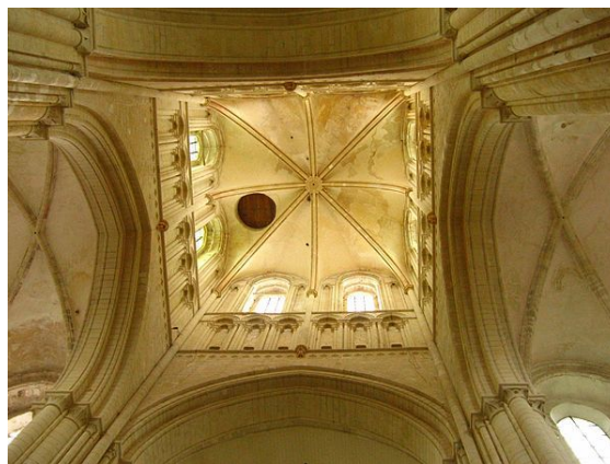
intérieur de l'église abbatiale de Fécamp