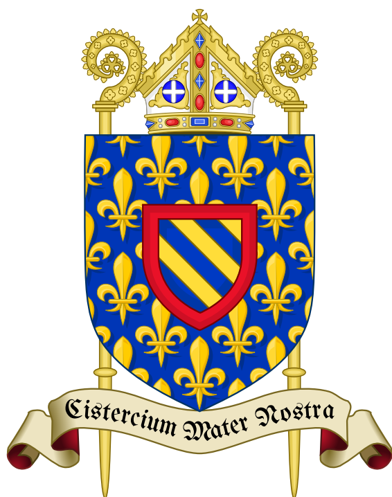
Blason de l'ordre cistercien

Cet article liste les abbayes cisterciennes actives ou ayant existé sur le territoire français actuel. Il s'agit des abbayes de religieux (moines et moniales) appartenant à l'ordre cistercien.